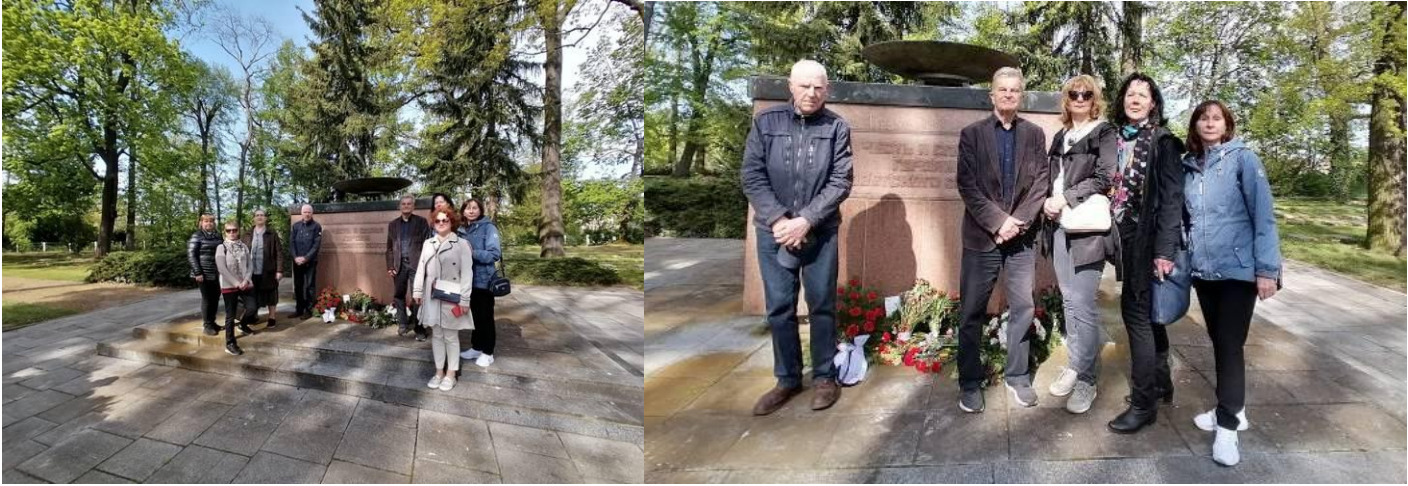
Kranzniederlegung von Deutsch-Russländischer Gesellschaft auf sowjetischen Ehrenfriedhof in der Stadt Wittenberg am 8. Mai 2023